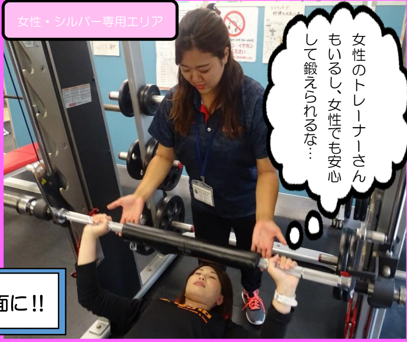
女性・シルバー専用エリア